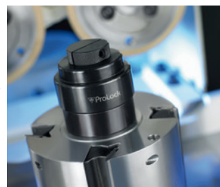
□ ProLock sistem za brzo stezanje